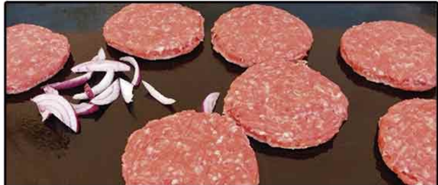
HAMBURGUESA MIXTA CERDO/TERNERA (100GR) CAJA 3 KG.