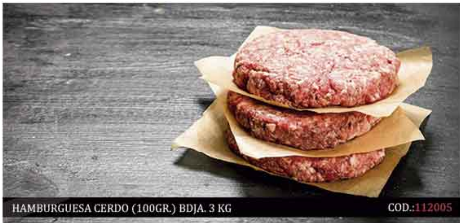
HAMBURGUESA CERDO (100GR.) BDJA. 3 KG