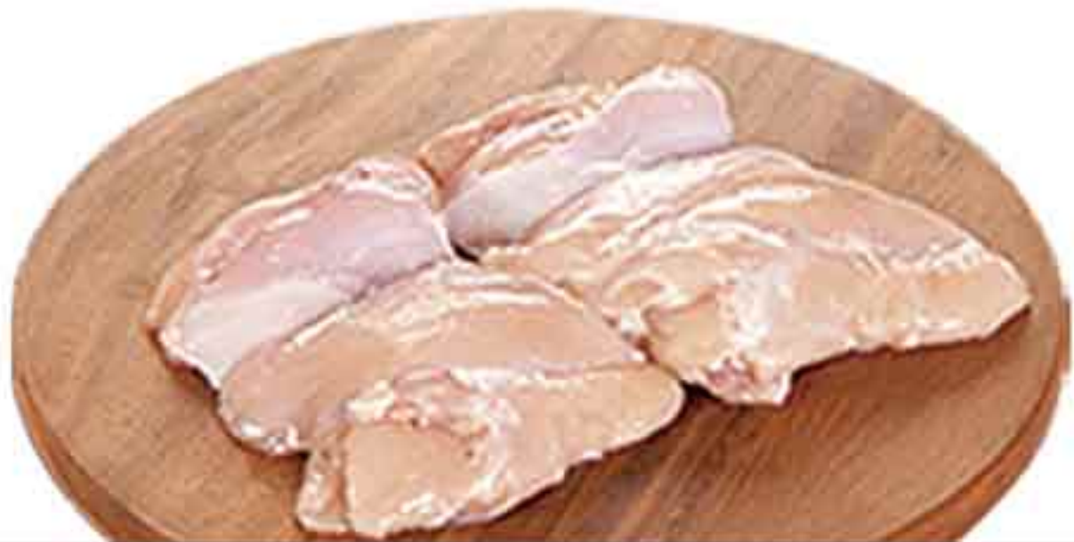
POLLO CHURRASCO ALIÑADO SIN PIEL BANDEJA 5 KG.