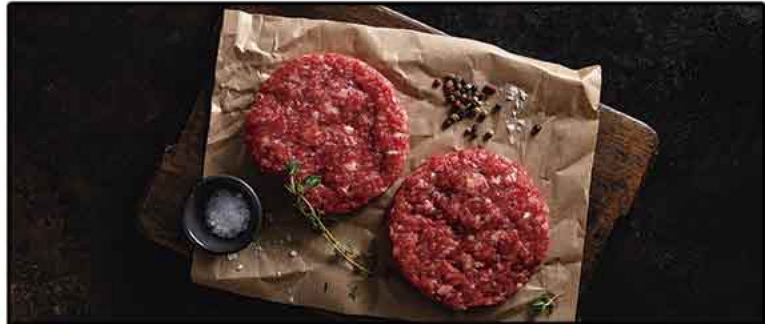
HAMBURGUESA VACA (170GR) BANDEJA 3 KG.