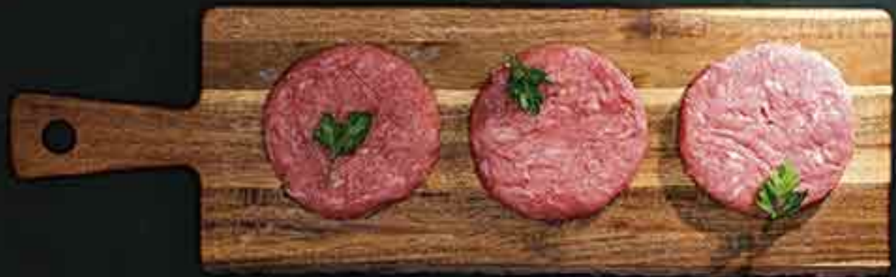
HAMBURGUESA POLLO 100GR. BANDEJA 3 KG.