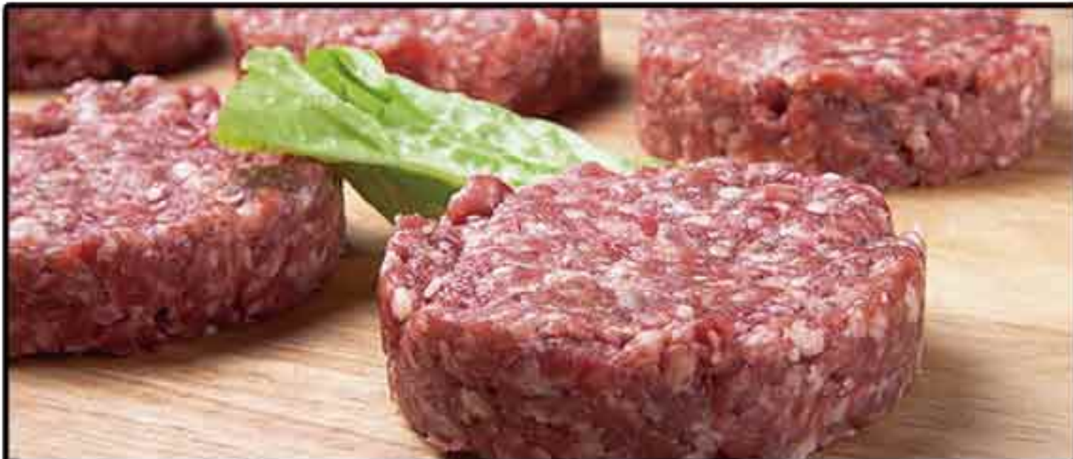
HAMBURGUESA AÑOJO (200 GR) BANDEJA 3 KG.