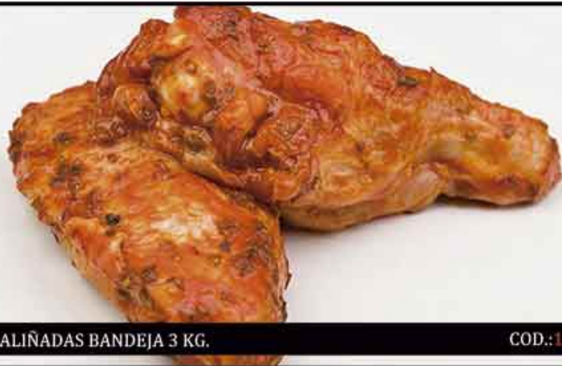
POLLO ALAS ALIÑADAS BANDEJA 3 KG.