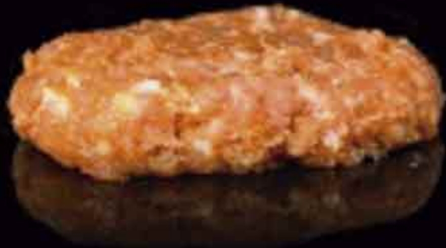
BURGUER MEAT POLLO CRESTA 100g. BANDEJA 3Kg APROX