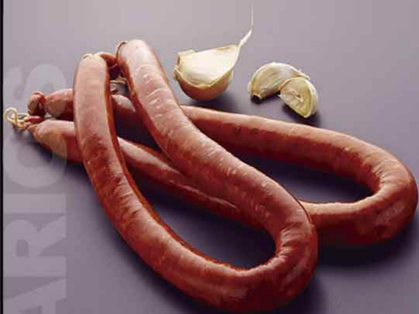
CHISTORRA ENVASE 3 KG.