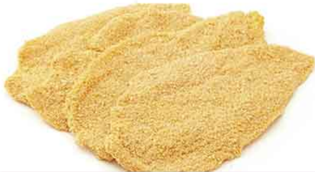
POLLO FILETES PECHUGA EMPANADA BANDEJA