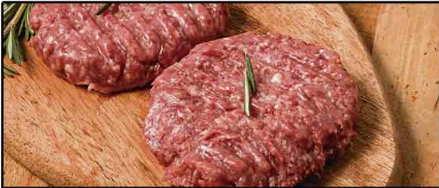
HAMBURGUESA ANGUS CAJA 4 KG..