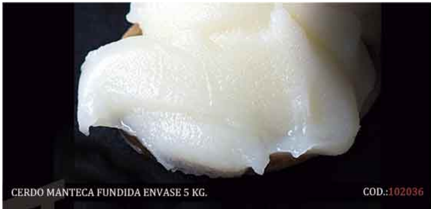
CERDO MANTECA FUNDIDA ENVASE 5 KG.