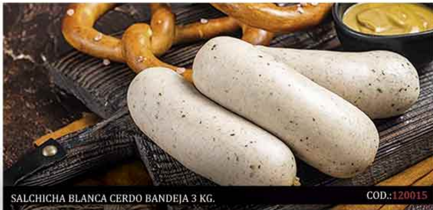
SALCHICHA BLANCA CERDO BANDEJA 3 KG.