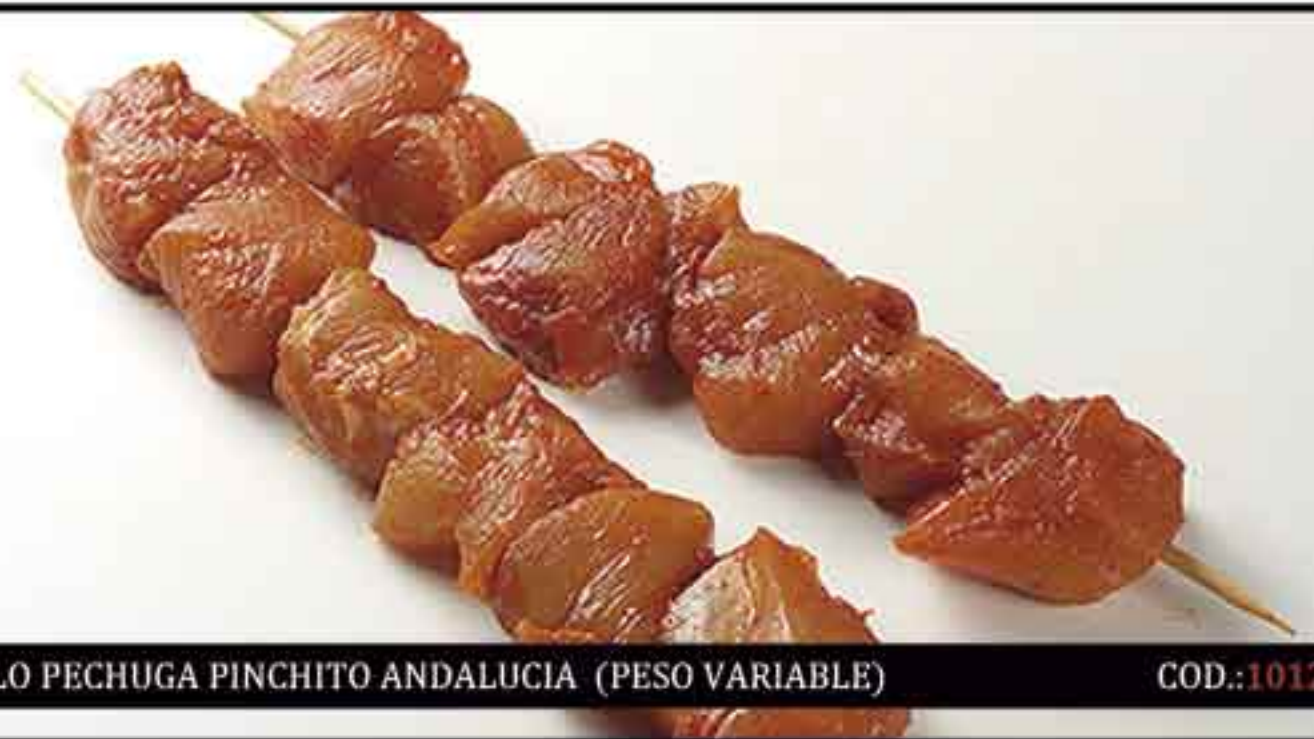
POLLO PECHUGA PINCHITO ANDALUCIA (PESO VARIABLE)