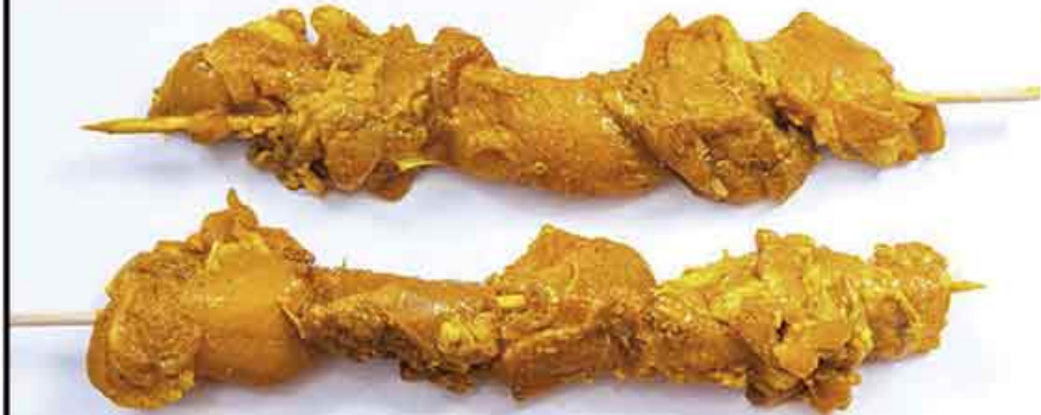
POLLO PINCHITO PINCHADO BANDEJA 1Kg