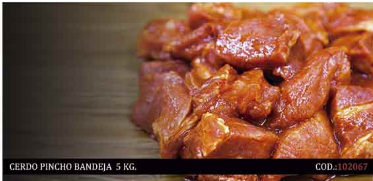
CERDO PINCHO BANDEJA 5 KG.