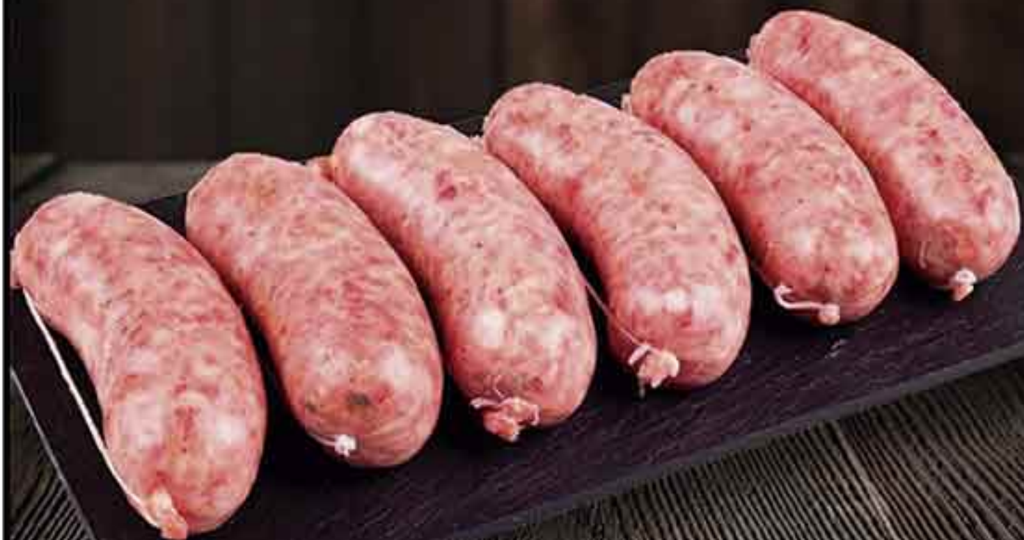
CHORIZO CRIOLLO BANDEJA 3 KG.